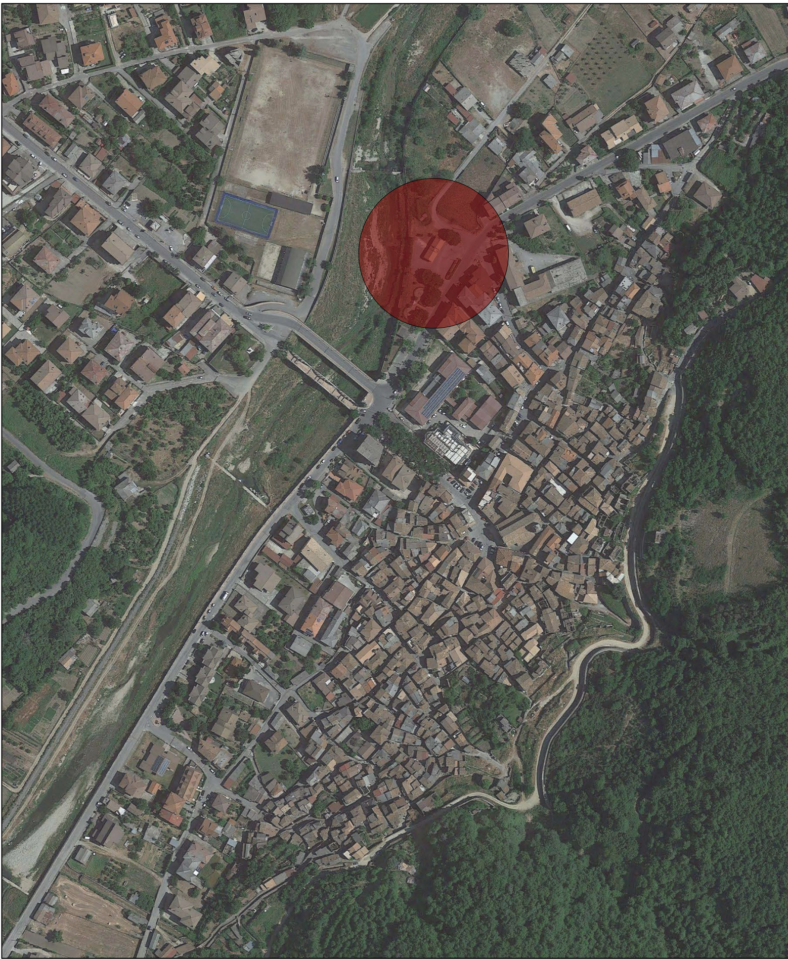
LOCALIZZAZIONE INTERVENTO COORD: 38°38'41.28"N 16°23'14.18"E